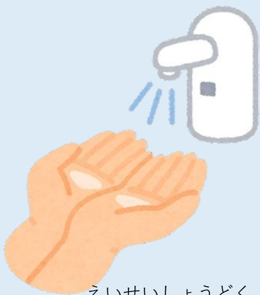
えいせいしょうどく 衛生消毒