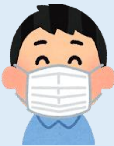
ちやくよう マスク着用